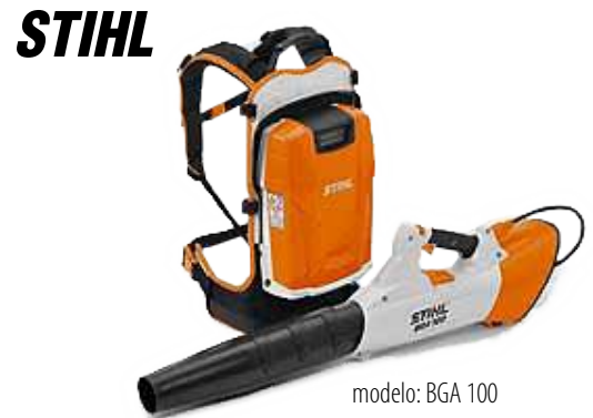
modelo: BGA 100

STIHL BR 500 $250 con intercambio (Valor original $479.95) Sopladora de mochila de gasolina