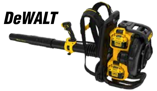
Model : DCBL590X2