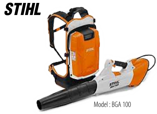
Model : BGA 100

Please note it is the user's responsibility to comply with all local ordinances pertaining to the use of this equipment.